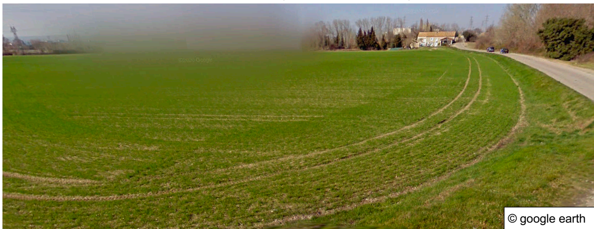
État de la culture en 2024 (céréales) ; l'horizon flouté correspond à la centrale du Tricastin