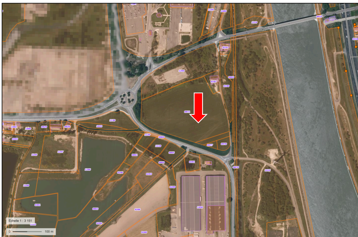
Emplacement du projet (flèche) ; découpage cadastral ; secteur flouté : centrale du Tricastin