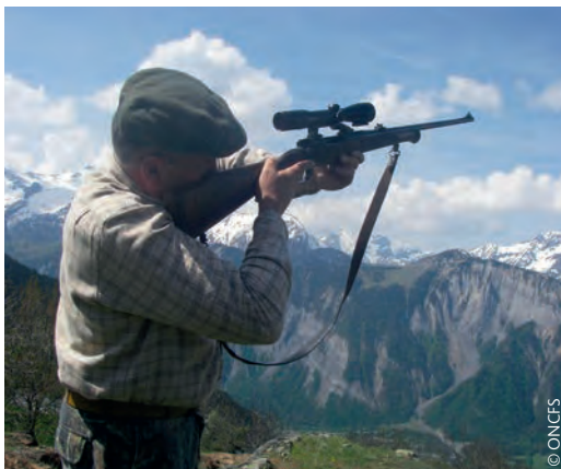
Vérification des canons : arme à verrou

Dans une zone de sécurité, il est impératif de s'assurer que les canons ne sont pas obstrués.