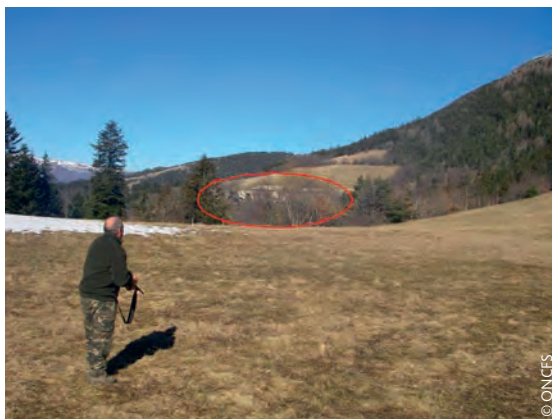
Zone d'exclusion de tir (habitations)