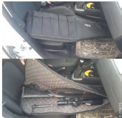
Transport de l'arme démontée et sous étui

S'agissant des conditions de transport des armes de chasse dans un véhicule, l'arrêté ministériel du 1 er août 1986 précise que toute arme de chasse ne peut être transportée à bord d'un véhicule qu'à condition que l'arme soit déchargée et placée sous étui ou démontée.