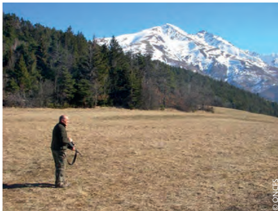
Zone de tir