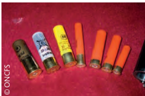
Munitions canons lisses