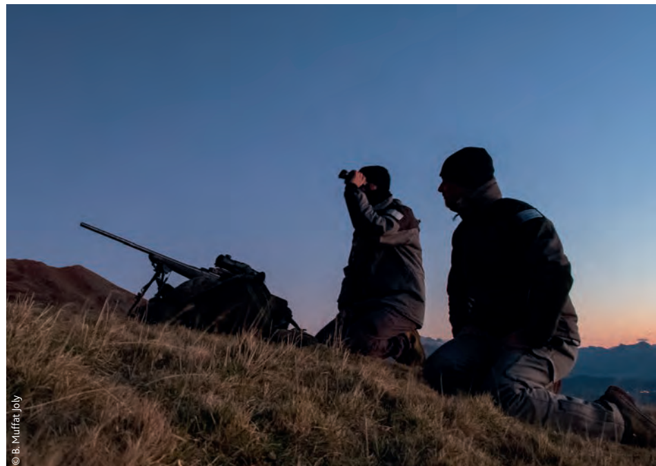
Détermination des distances de tir avec un télémètre