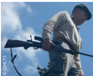
Franchissement d'obstacle : arme sécurisée (déchargée, culasse ouverte)