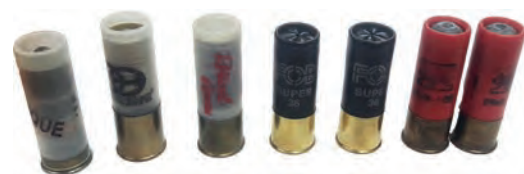
Munitions à grenailles ou à balles