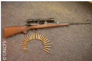
Munitions canons rayés