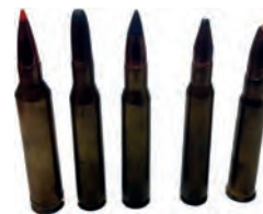
Munitions de grande chasse > 7 mm

Pour les armes lisses, l'emploi des balles ou des munitions avec des grenailles d'un diamètre supérieur à 3,5 mm en munition magnum et avec un canon full choke est conseillé. Pour des raisons de sécurité et de balistique, l'emploi de chevrotines est à proscrire.