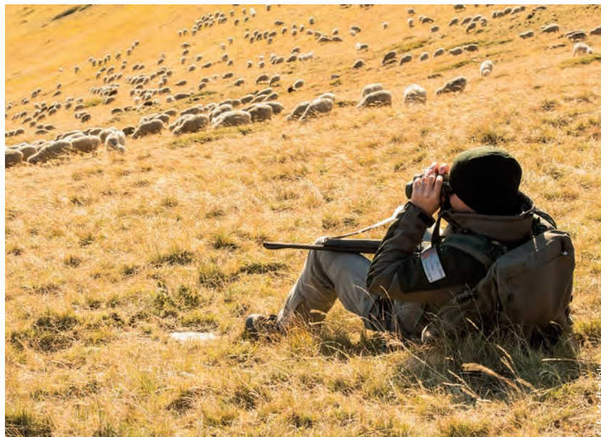
Reconnaissance du territoire en journée

Ces éléments permettront notamment d'établir avec pertinence des zones de sécurité.