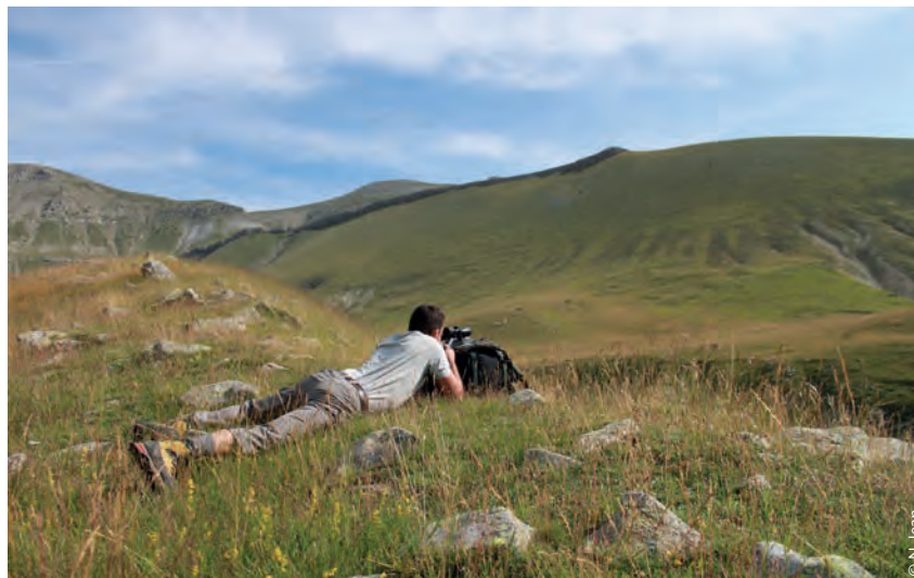
Tir fichant (image de jour, agent appuyé sur son sac)

Inversement, un tir rasant correspond à un tir sur une ligne de crête ou parallèle à la pente (aussi bien en montée qu'en descente) où le projectile va raser le sol pour poursuivre sa trajectoire et terminer sa course en un point d'impact inconnu. Le tir rasant est donc à proscrire.