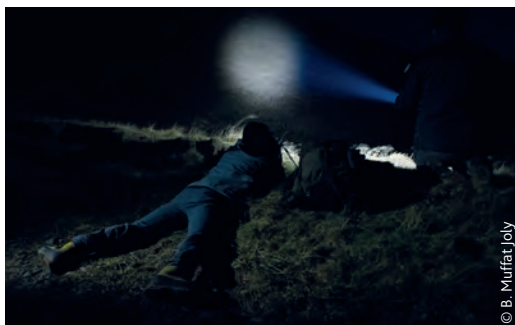
Identification avant tout tir de nuit à l'aide d'un projecteur (image de nuit)

Chaque tir doit être fichant sur un animal immobile ou à faible allure. Un tir fichant est un tir pour lequel le projectile va finir sa course dans le sol à une distance très courte après avoir touché la cible.