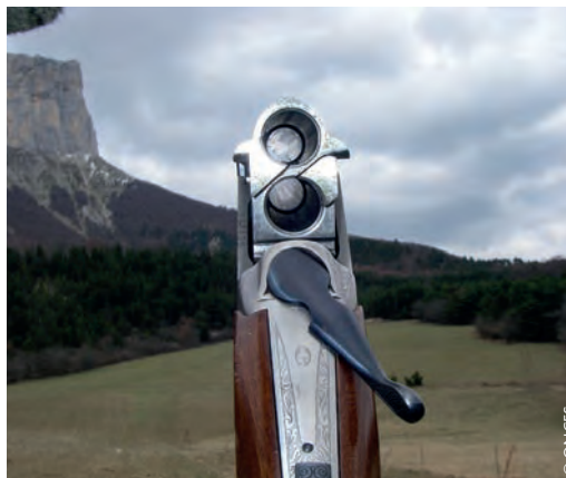
Vérification des canons : arme basculante