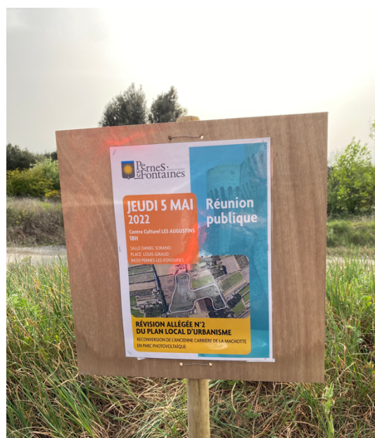
Affichage sur la carrière de la Machotte, le lieu du projet

Le rapport de constatation figure en annexe.