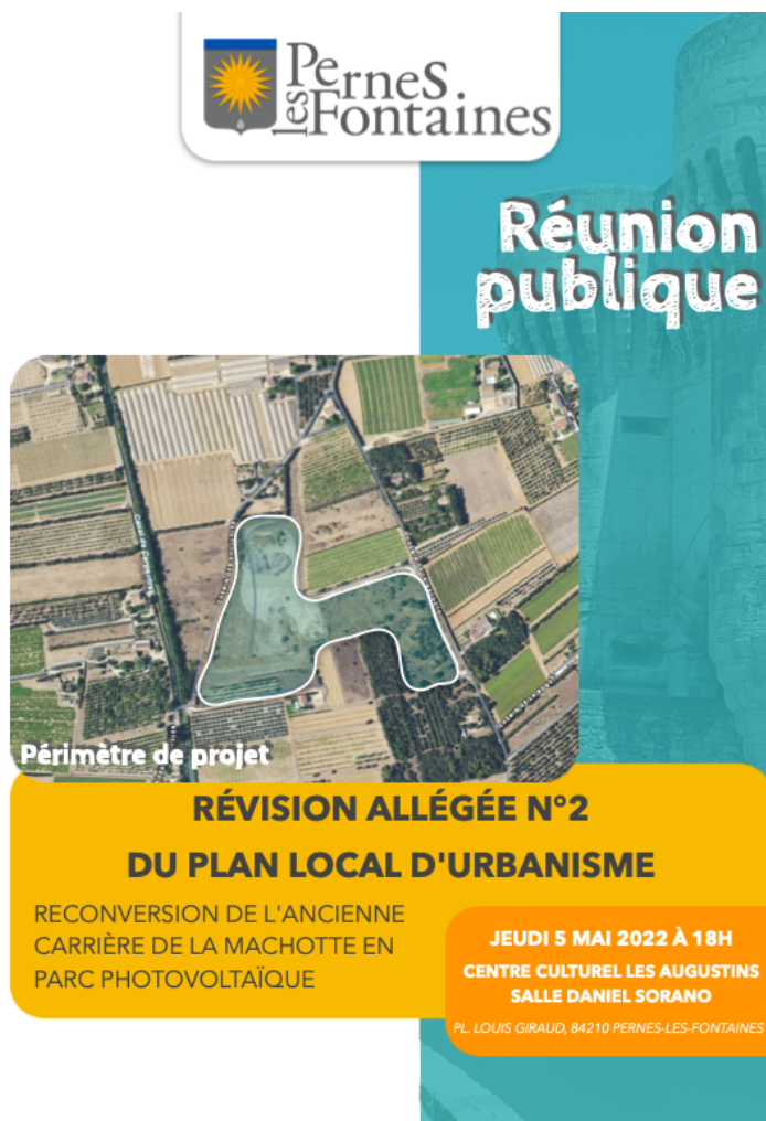
L'affiche de la réunion publique

Elle a eu lieu le 5 mai 2022, en présence notamment de M.le Maire, de Neosolar (porteur de projet) et de JD Urbanisme (en charge de l'évolution du Plan Local d'Urbanisme).